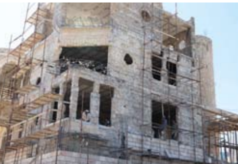
Hausrenovierung in Beit Jala nach Armeebeschluss. Weihnachtskrippe „Real“ - mit Mauer.