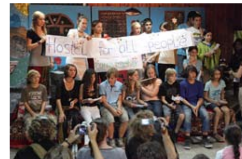
Finale des Theaterstückes „Schwerter zu Pflugscharen“ in einem Restaurant in der C-Zone.