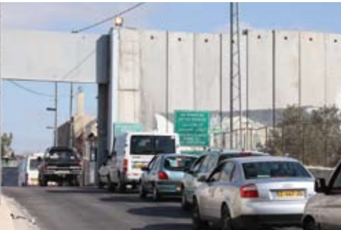
Wer nach Jerusalem, will muss durch diesen Checkpoint in der 8 Meter hohen Grenzmauer.