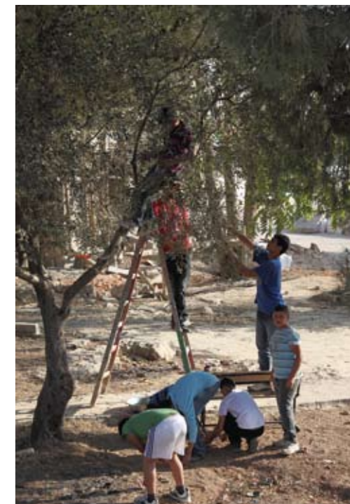
Olivenerte in Beit Jala. Bei der Abschlußparty werden Autogramme aufs T-Shirt geschrieben.