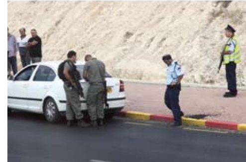
Israelische Verkehrskontrollen mit Maschinenpistolen gehören zum Alltag in Palästina.