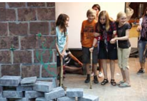
Die Kinder erarbeiten spielerisch verschiedene Rollen und Menschenschicksale.