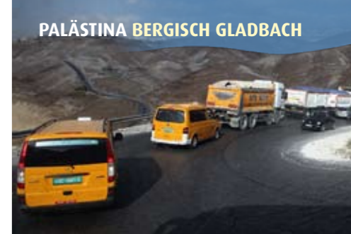
Zwei-Klassen-Gesellschaft auf den Straßen. Moderne Highways gibt es nur für Israelis.

Der gigantische Mauerbau der Israelis hat den Wahnsinn der DDR längst übertroufen. Siedlungen und Straßen auf Palästinensergebieten werden durch acht Meter hohe Betonmauern geschützt. Das ganze Land wird dadurch zerstückelt und das palästinensische Straßennetz zerstört.