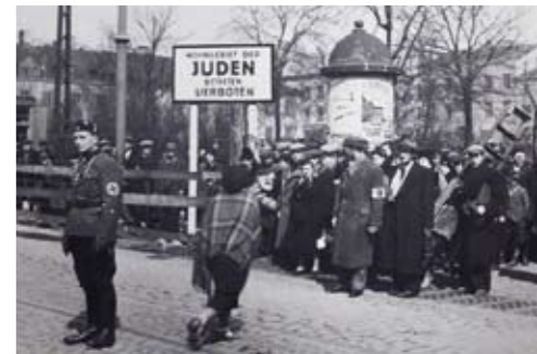
Parallelen? Deutsche durften nicht ins Juden-ghetto, Israelis dürfen nicht nach Palästina.