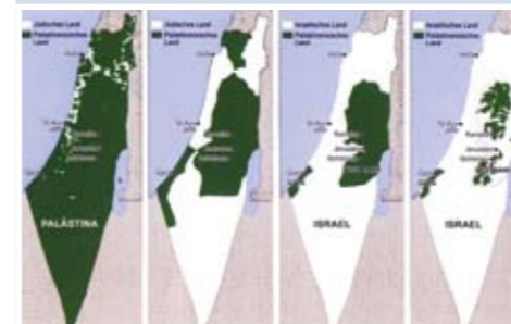
Annektierung palästinensischen Landes durch Israel seit 1946. Die grünen Flächen sind das, was heute von Palästina übrig geblieben ist.

Die israelische Regierung verbietet ihren Bürgern die Zonen A und B zu betreten. Palästinenser dürfen nur mit Sondergenehmigung nach Israel. In B und C unterhält Israel über 700 Checkpoints und Straßensperren.