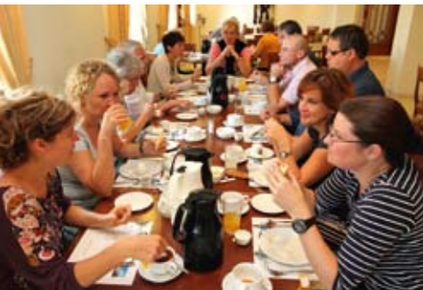
Lagebesprechung beim gemeinsamen morgendlichen Frühstück.