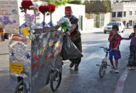
Straßenhändler mit selbst gemachten Softdrinks in Bethlehem.