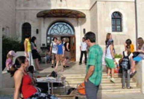
Vor dem nächsten Ausflug trifft man sich vor der Abrahamsherberge in Beit Jala.