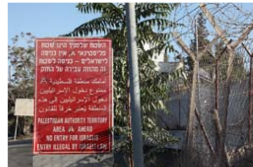
Unten: Yad Vashem in Jersualem ist ein beeindruckendes Mahnmal gegen den Holocaust.