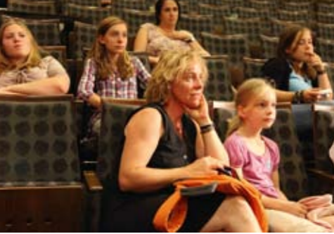
Nur mit Sondergenehmigung für Palästinenser möglich: Proben in Jersualemer Cinemathek.