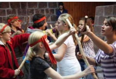
Action: Kriegerische Auseinandersetzungen werden auf der Bühne nachgestellt.