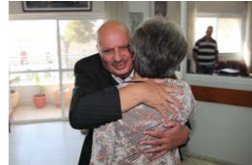
Begrüßung durch den Bürgermeister von Beit Jala. Unten: Illegale israelische „Siedlung“.