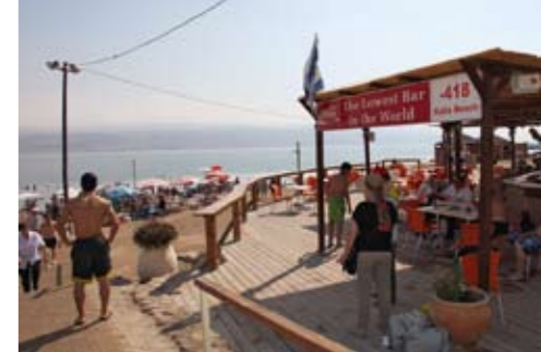
Der Wasserspiegel des Toten Meeres sinkt jedes Jahr um einen weiteren Meter.