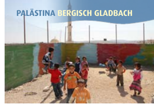
Der Kindergarten ehemaliger Beduinen, wird von der ev. Gemeinde Bensberg unterstützt.