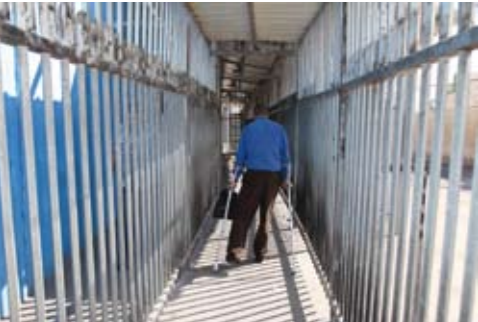
Kein Löwenkäfig, kein Checkpoint Charlie, sondern der Grenzübergang nach Jerusalem.