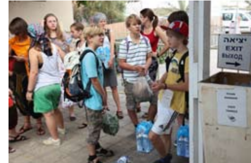
Fremd im eigenen Land: Hinweisschilder gibt es nur in Hebräisch, Englisch und Russisch.