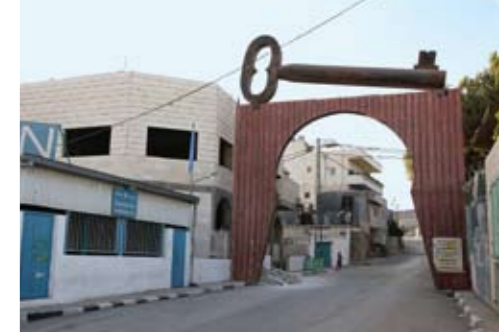
Flüchtlingscamp: Der Schlüssel ist Symbol für die Hoffnung auf Rückkehr in die Heimat.