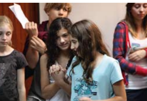
Zärtlich oder sportlich, Freundschaft zwischen palästinensischen und deutschen Kindern.